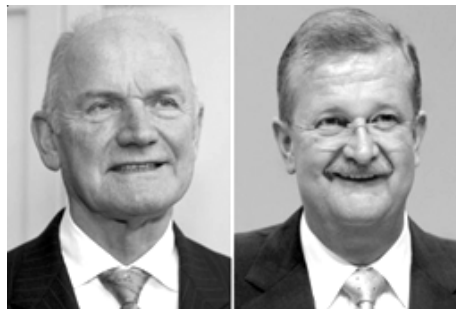
Die Bestimmer; Piëch und Wiedeking