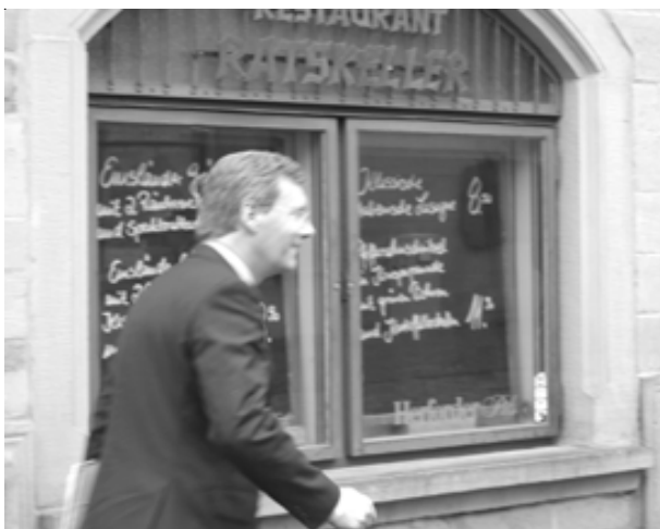
Wulff auf der Flucht vor streikenden ver.di-Kollegen

„Ministerpräsident Christian Wulff hat sich nach den ersten Sanierungsgesprächen bei VW für Mehrarbeit ohne Lohnausgleich ausgesprochen.“ (NOZ, 14. 06.2006). Es dürfte klar sein: wenn die inländischen VW-Werke ihre Arbeitszeit erhöhen, steigert das deren „Probleme, ihr eigenes Personal auszulasten“ (N. Meyer, NOZ, 2. 10.2007) – mit den bekannten Negativfolgen für uns bei Karmann.