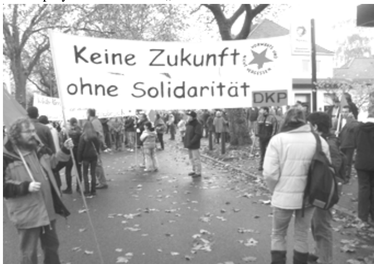
Genossinnen und Genossen der DKP-Osnabrück auf der großen Karmann-Demo

Dienstag, 04. Dezember, 18:30, Lagerhalle